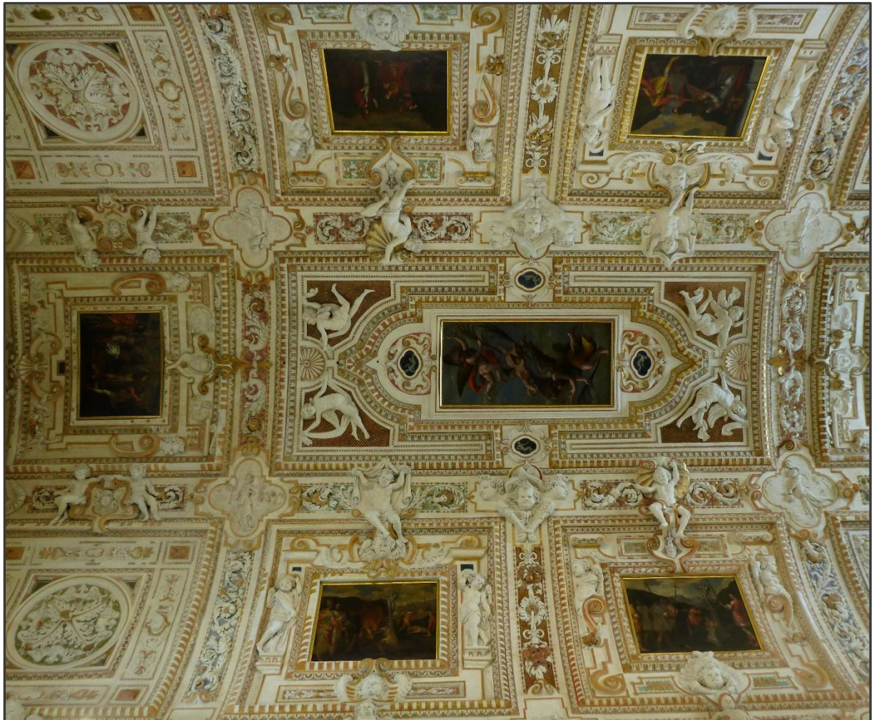
Palazzo Fugger, Trento, cappella Santi Martiri ananicesi, 1608

Castel Valer , per imponenza e suggestione una sorta di maestà dei castelli Trentini Tirolesi. Costruito dal XIII al XVI secolo dai conti di Appiano, di proprietà dei Còredo per quasi tutto il XIV secolo, passo agli Sporo o Spaur, che lo detengono tutt'ora. L'interesse di Castel Valer non riguarda solo uno dei più caratteristici sistemi fortificati trentini ma anche nella sua straordinaria conservazione dovuta alla cura particolare posta dai proprietari Conti Spaur nella continuativa manutenzione. Abitato tutto l'anno vi è quindi, accanto all'aspetto puramente castellogico anche il fascino di una dimora viva, nella quale si possono leggere con chiarezza le tappe evolutive da macchina bellica a fastosa residenza signorile. L'arredamento, i rivestimenti lignei delle pareti e dei soffitti, i pavimenti intarsiati, i pannelli decorativi a fresco, le monumentali stufe di ceramica sono parte essenziale per la comprensione dell'organicità del complesso. La visita al Castel Valer, quasi una cittadella fortificata, è non è solo di grandissimo interesse storico e culturale, ma è anche un'esplorazione nel mondo della magistrale tutela e conservazione di un bene culturale tutt'ora privato.