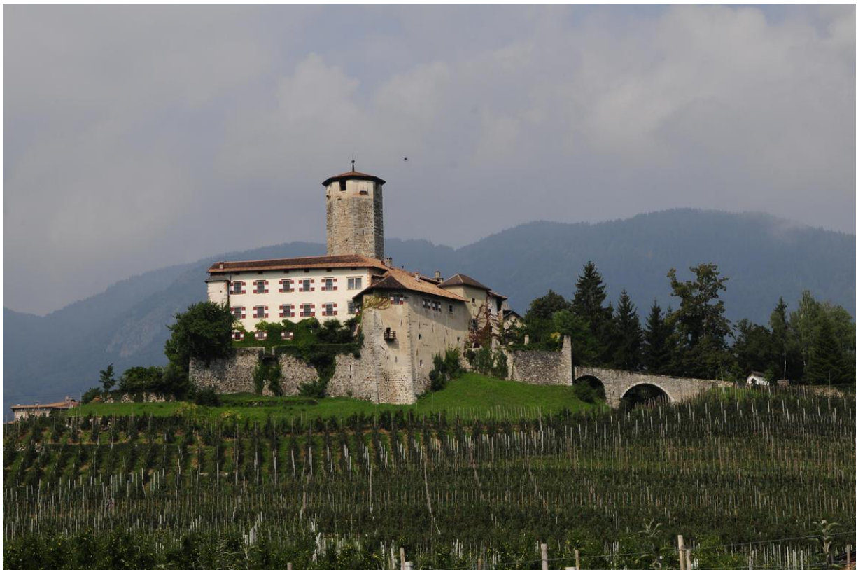
Castel Valer da sud